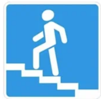
Надземный пешеходный переход