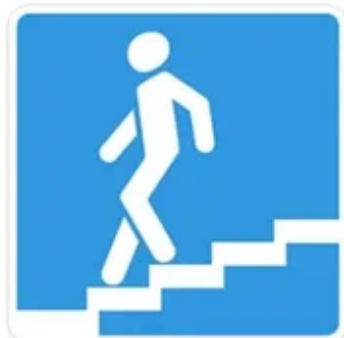
Подземный пешеходный переход